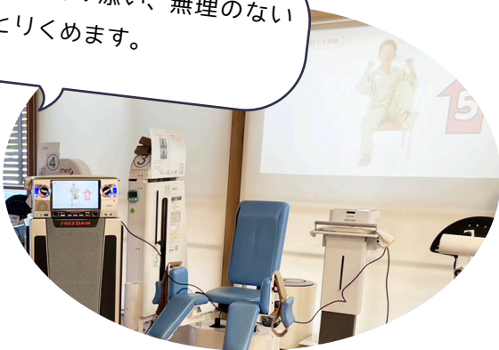
映像を使った脳トレ/リズム体操