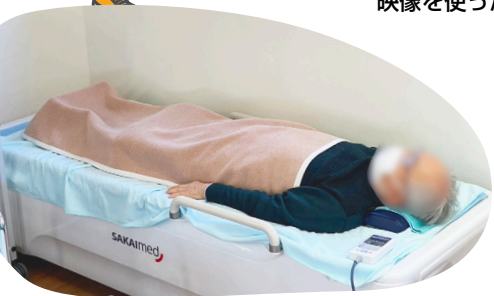
ウォーターベッドを使ったリラクゼーション